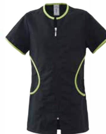
Z3 NERO/VERDE ACIDO