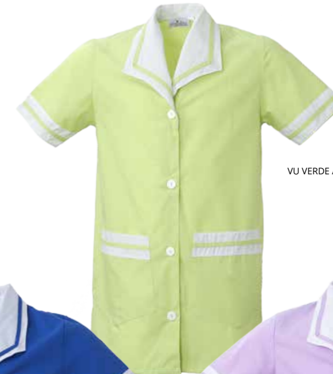
VU VERDE ACIDO/BIANCO