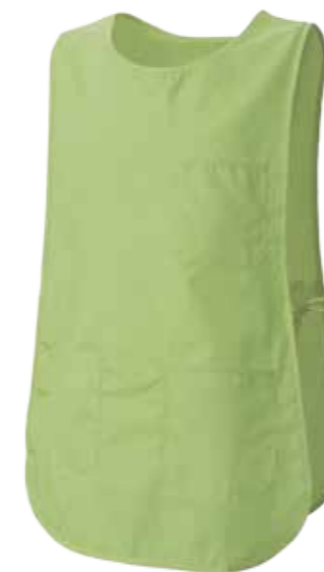
VT VERDE ACIDO