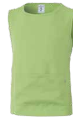
VT VERDE ACIDO