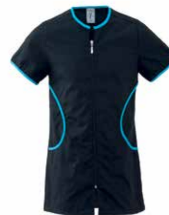
Z2 NERO/ TURCHESE