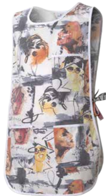
FA FACCE ARANCIO