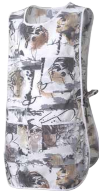
FG FACCE BEIGE