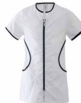
ZJ BIANCO/ NERO

COLORI ZJ BIANCO/NERO Z1 NERO/FUXIA Z2 NERO/TURCHESE Z3 NERO/VERDE ACIDO