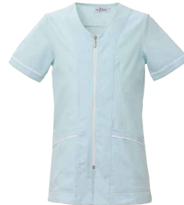
VE VERDE ACQUA/BIANCO