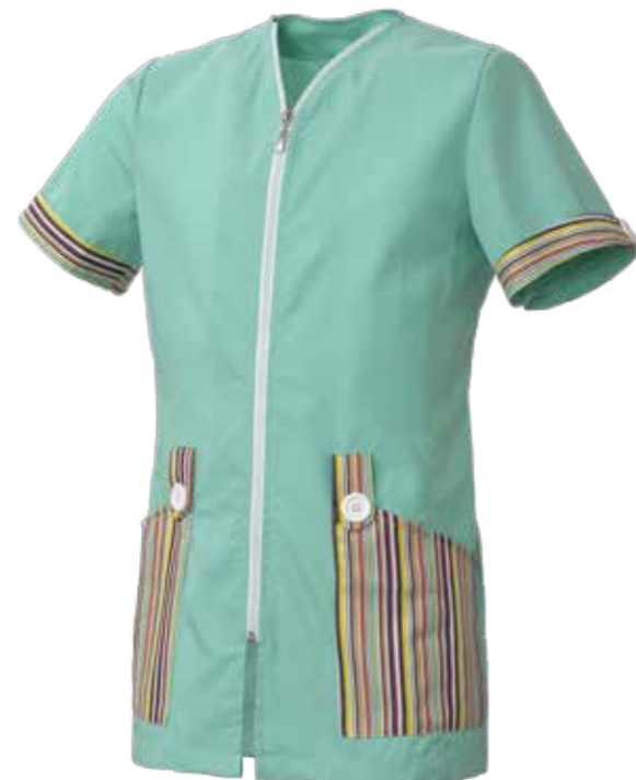
V1 VERDE ACQUA/FANTASIA

COLORI B4 BIANCO/FANTASIA V1 VERDE ACQUA/FANTASIA G1 GIALLO/FANTASIA