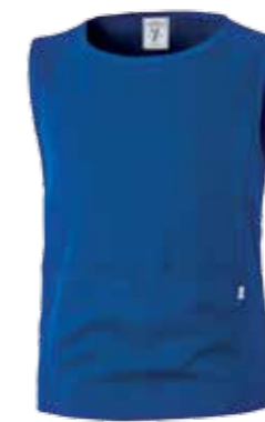
06 AZZURRO ROYAL