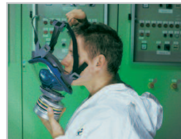
Posizionare il mento nella mentoniera