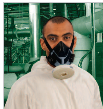
Advantage 410 con filtro P3 PlexTec

Per maggiori informazioni sui filtri con filettatura standard, vedere il depliant 05-100.2.