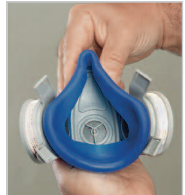
Gruppo facciale Anthrocurve

Advantage 200 LS è una semimaschera comoda, efficiente ed economica. E' ideale per applicazioni in cui l'operatore è esposto a pericoli di vario tipo, a seconda del tipo di intervento, ad esempio un'elevata concentrazione di fumi, nebbie e gas.