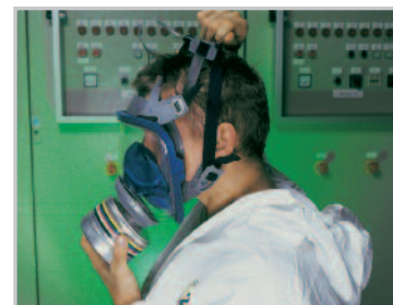
Far passare la bardatura sopra la testa