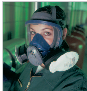
Advantage 3200 con TabTec e FLEXIfilter

Le tre linee di filtri si usano con Advantage 3200, Advantage 200 LS e Advantage 420.