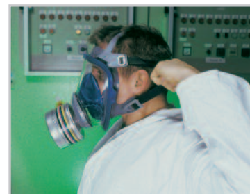
Stringere le due cinghie inferiori

La maschera a pieno facciale serie Advantage 3000 fornisce sia una protezione che un comfort davvero impareggiabili. Il morbido bordo di tenuta è realizzato in silicone anallergenico. L'ampio visore, otticamente perfetto, assicura una visibilità chiara e priva di distorsioni, mentre il colore grigio-blu rende la maschera esteticamente piacevole.