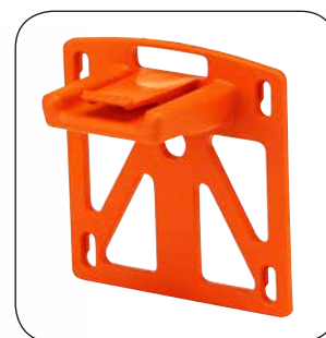
SUPPORTO A MURO INCLUSO