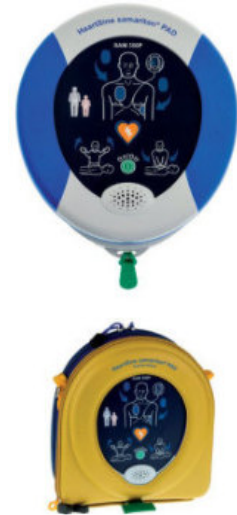
Borsa da trasporto

Pak-Pediatico per bambini sotto gli 8 anni o di peso inferiore ai 25 kg. 4 anni di validità.